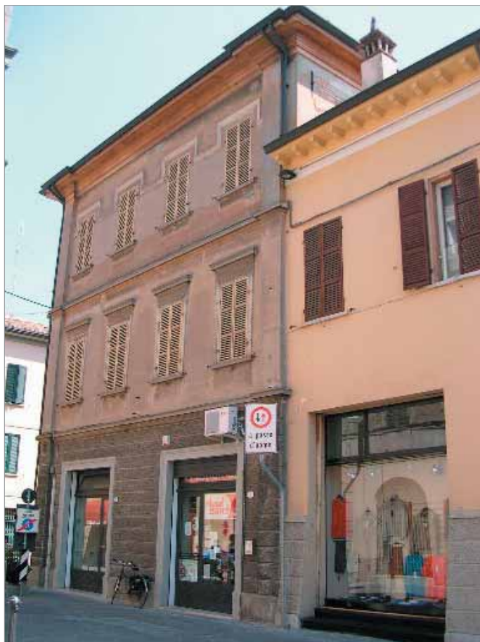
Corso Matteotti 2; 2a Fronte Principale