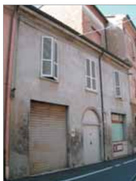
Fronte Laterale Via Fiume 2; 2a; 2b; 2c